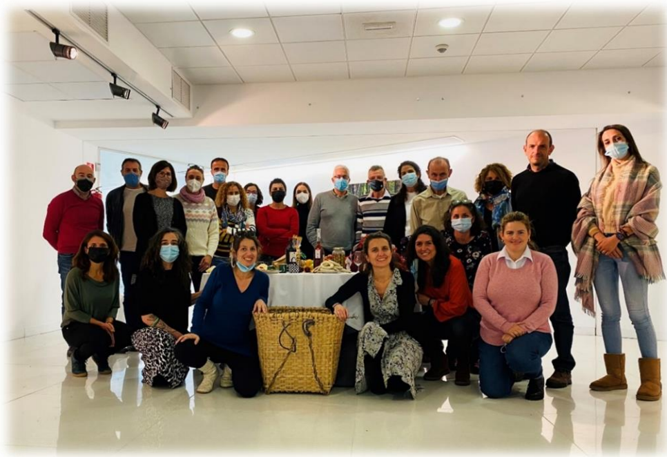
Equipos técnicos de los 12 GAL participantes en TerrAlimenta, equipo de Red2red y de la FDNC

Los días 10 y 11 de noviembre celebramos en Zaragoza el primer encuentro presencial del proyecto TerrAlimenta: Grupos de Acción Local en transición hacia Sistemas Alimentarios Sostenibles , promovido por la Fundación Daniel y Nina Carasso e impulsado en colaboración con el equipo de Red2Red. El encuentro nos permitió conocernos en persona, intercambiar los avances en este proceso de transición y los objetivos de cada uno de los 12 Grupos de Acción Local participantes, entre los que está nuestro GDR Campiña de Jerez y Costa Noroeste de Cádiz, y comenzar a construir de forma colectiva los objetivos comunes que este "grupo de grupos" persigue.